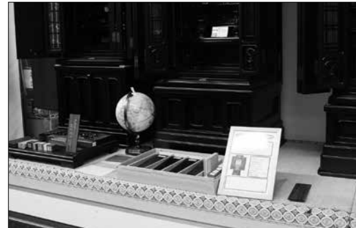
唐木仏壇の店頭表示 材料見本や地球儀などを活用して説明する