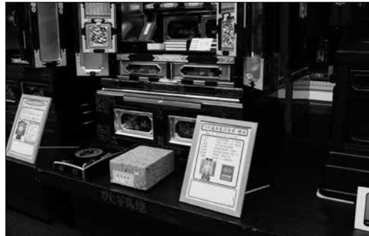
木地・塗り・金箔・蒔絵・金具・彫物・屋根についてその内容を詳細表示