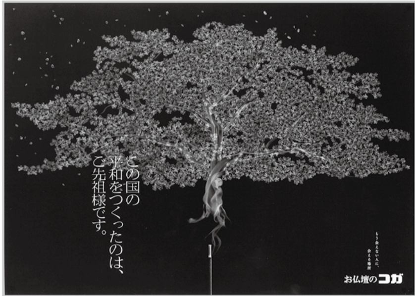
桜 「この国の 平和をつくったのは、ご先祖様です。」