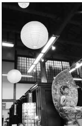
広々とした 空間イメージの1階