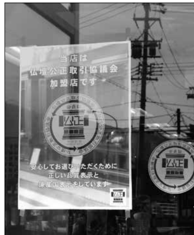
店頭のショーウィンドウに仏壇公正取引協議会のポスターでPR (太田屋 やすらぎ館 諏訪インター店)

太田屋は長野県内に九店舗を展開、全店で仏壇公正競争規約に対応した品質表示と原産国表示を実施している。今回、取材に対応して頂いたのはやすらぎ館 諏訪インター店店長の河元浩一氏、昨年四月二十七日の一部規約の施行前から、新たに商品表示を刷新、また仏壇公正競争規約のパンフレットも自社で作成し、同規約の紹介を行っている。店頭の様子をショールームや店内には仏壇公正取引協議会のポスターを貼り、PRを図っている。河元氏は「他店との差別化につなげられれば」と話す。